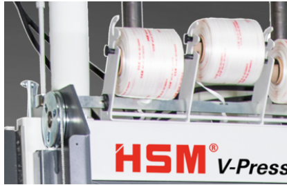
Atadura manual de la bala con cinta continua de poliéster