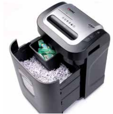
Depósito recolector independiente integrado para una clasificación ecológica de los desechos de papel y CD, DVD, tarjetas bancarias y de crédito