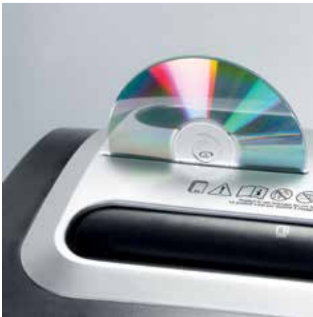
Mecanismo de corte independiente con ranura de introducción para CD, DVD y tarjetas para una destrucción más segura