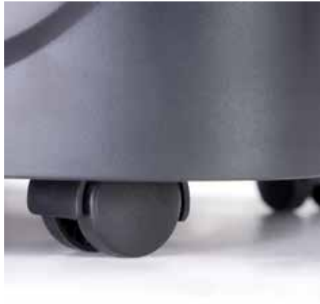
Prácticas ruedas orientables para el uso flexible