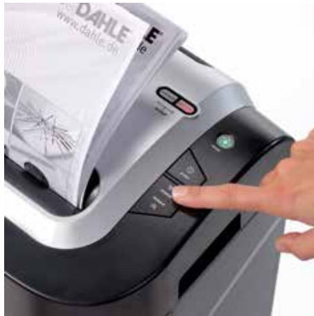
Confortable función de avance/retroceso para un manejo manual de la alimentación con papel