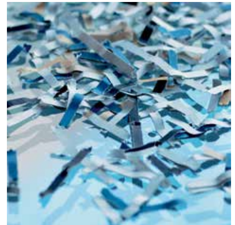
Nivel de seguridad P-4: Recomendado para soportes con datos particularmente sensibles, confidenciales y personales