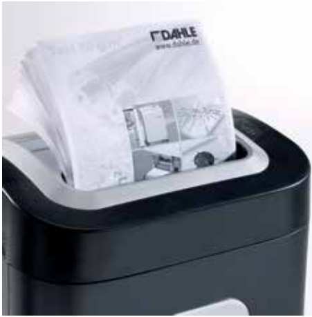
Fácil introducción del papel hasta el formato A5